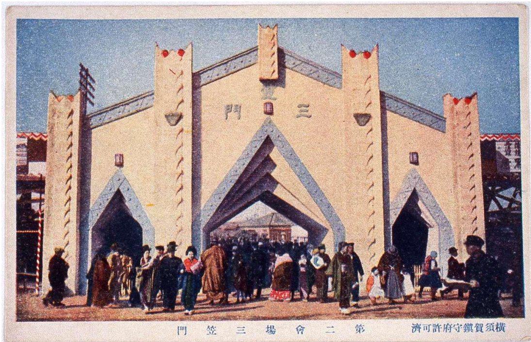
門 笠 三 場 會 二 第 濟 可 許 府 守 鎮 賀 須 橫