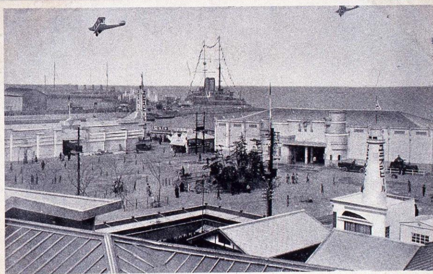
(済開檢二の九一號四一第銀横月三年五和昭)