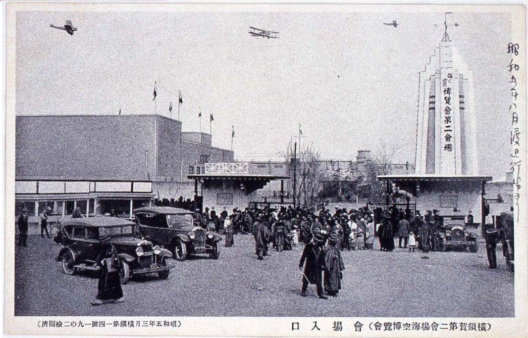
(濟 岡 檢 二 の 九 一 號 四 一 第 鎮 橫 月 三 年 五 和 昭)