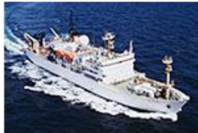
海洋地球研究船 「みらい」