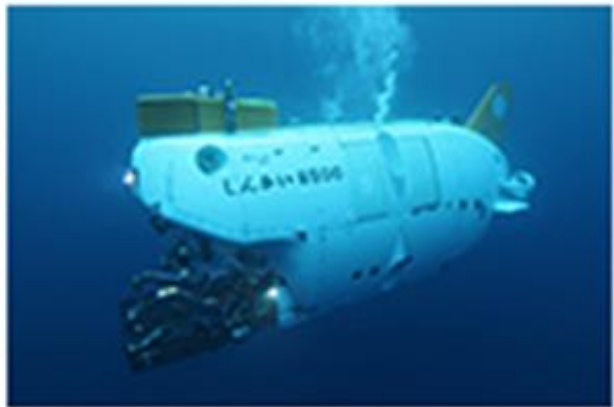
有人潜水艇 「しんかい6500」