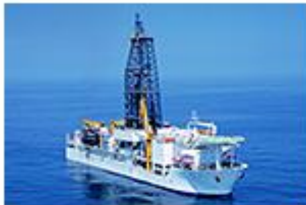
地球深部探査船 「ちきゅう」