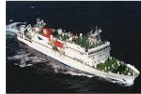
深海調査研究船 「かいらい」