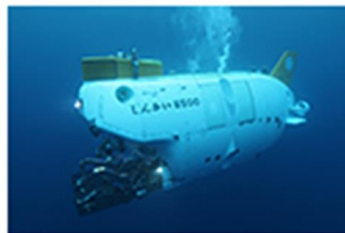
有人潜水艇 「しんかい6500」