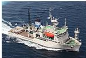
東北海洋生態系 調査研究船 「新青丸」