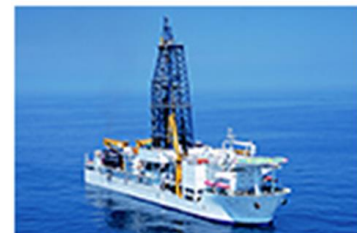
地球深部探査船 「ちきゅう」