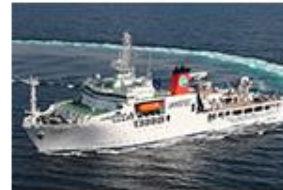
海底広域研究船 「かいめい」