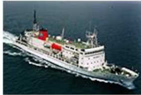
深海潜水調査船 支援母船 「よこすか」