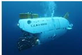
有人潜水調査船 「しんかい6500」