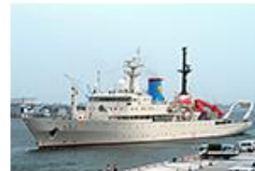
学術研究船 「白鳳丸」