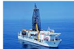
地球深部探査船 「ちきゅう」