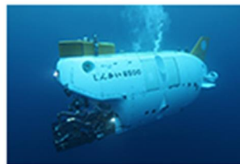
有人潜水艇 「しんかい6500」