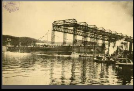
大正9年 横須賀海軍工廠で進水